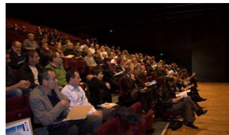
1 ère édition des Journées Pyrénéennes de Prévention des Risques Naturels